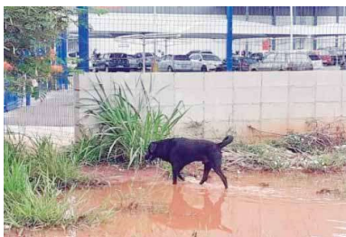
Imagem: cachorro que flagrei hoje, por volta do meio-dia, em frente à FEG (Olivaldo Júnior)

mas, mesmo com todo açote enche a mim com suas cores!