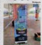
Terminais de ônibus. O projeto Viajando na Leitura tem apoio de Rotary, Prefeitura do Município de Piracicaba e Transporte Urbano Piracicaba (Tupi) e patrocínio do Pecege e Colégio Objetivo.

Para mais informações: Instituto Histórico e Geográfico de Piracicaba, telefone 19-3434-8811 ou e-mail ihgp@ihgp.org.br .